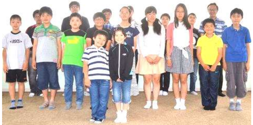
2015 ブリッツキング大会