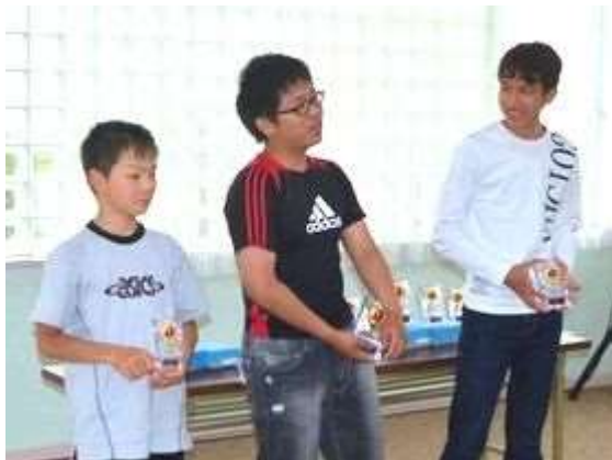
2015ブリッツキング大会1位～3位