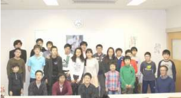
函館チェス大会 2015 (写真はデータであります！)