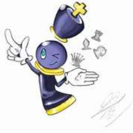
函館チェス大会ロゴ (右)