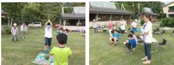
意外に盛り上がった西瓜割り

oooooooooooooooooooooooooooooooooooooooooooooooooooo