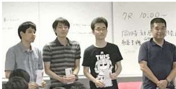
ジャパン・リーグAクラス入賞者

8月11日～14日、東京にてジャパン・リーグが行われました。全47名参加。全日本選手権と並ぶFIDE公式戦であり、中国のGM、IM2名と主だった日本のトップが参加した大会です。