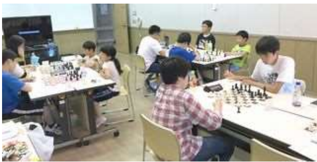
チェス三昧で腕を磨く

8月6日、7日、大沼にあるネイパル森において初のチェス合宿を行いました。初日はハイレベルのレクチャーとクラシカル・ゲーム、二日目はブリッツ&ハンディ戦のチェス三昧で腕を磨きました。